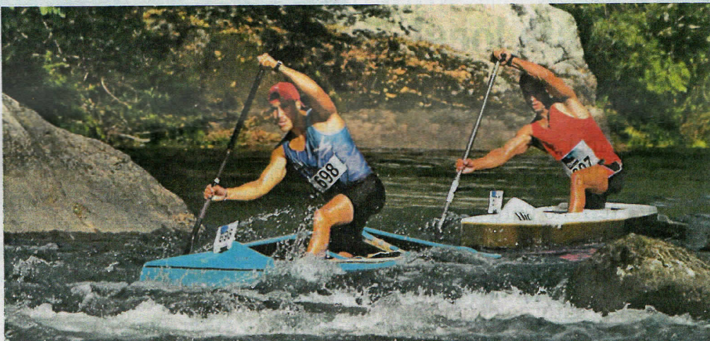
La Baixada do Eume, que este año se disputará el día 31 de agosto, llegará a su cuadragésimo séptima edición [FIRRETE]

En el pasado año 2012 el Náutico Firrete llenó el río Eume de piraguas, haciendo de Pontedeume la capital de este deporte en la provincia de A Coruña. Su conocida y laureada escuela de piragüismo contó este año con 120 alumnos, a los que hay que añadir cerca de dos mil personas que se acercaron a este deporte por medio de su programa de promoción del piragüismo, el «Firrete Aventura», que contó con una oferta muy variada de unidades didácticas entre las que sobresalían la